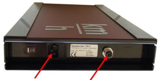
Netzkabel und Sensorkabel einstecken